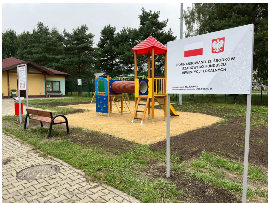
Plac zabaw przy kompleksie rekreacyjno – sportowym za Szkołą Podstawową