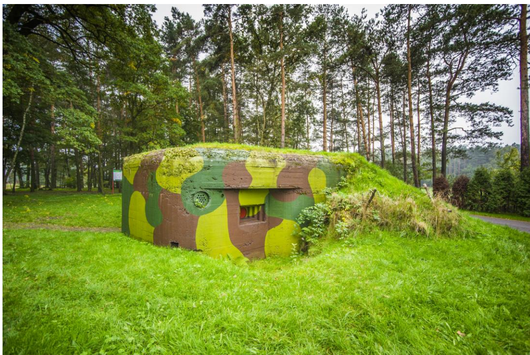
Schron bojowy „Sowiniec”

Na terenie miejscowości Gostyń znajdują się również budowle fortyfikacyjne z 1939 r. Są to 2 schrony: przy ul. Tęczowej (tzw. „Sowiniec”) oraz w rejonie Starej Piły. Na terenie kompleksu leśnego można znaleźć fragmenty nieukończonych budowli (fundamenty).