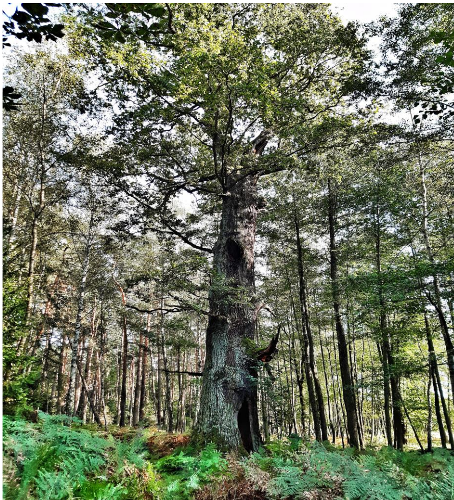
Dąb szypułkowy – pomnik przyrody