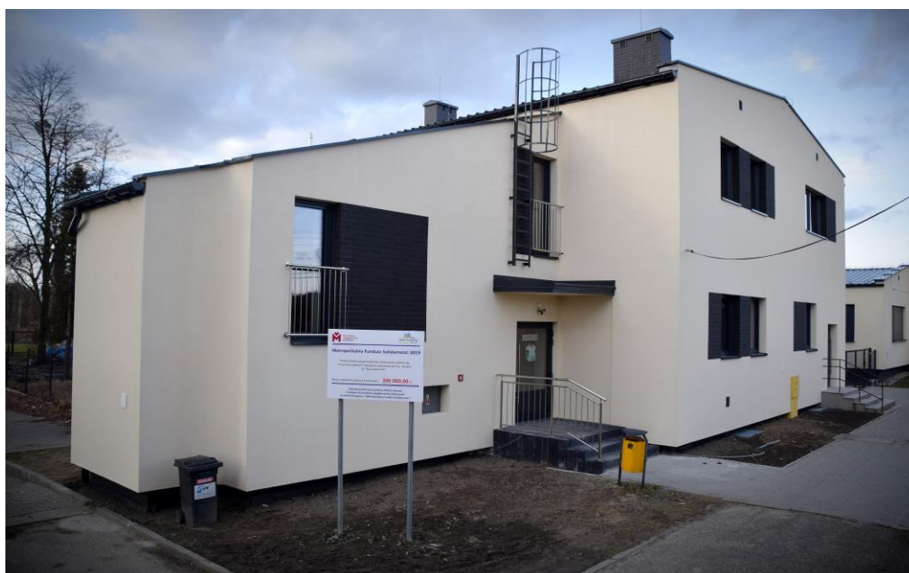
Siedziba świetlicy środowiskowej w Gostyni

Opiekunowie w świetlicy dbają by dzieci miały dobrze zorganizowany czas wolny. Dzieci korzystają z udostępnionych dla nich różnego rodzaju gier, zabaw, oglądają filmy, bajki. Często wychodzą także na spacerów bądź uczestniczą w zorganizowanych wycieczkach. Kiedy trzeba odrobić pracę domową także mogą skorzystać z pomocy w nauce, opiekunowie również starają się rozwijać zainteresowania wśród młodzieży, poprzez organizację różnych zajęć tematycznych.