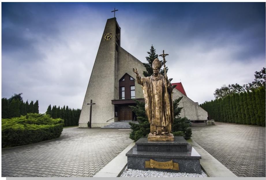
Kościół p.w. Podwyższenia Krzyża Świętego

Obok cmentarza parafialnego przy ul. Rybnickiej znajduje się kaplica cmentarna (wcześniej kościół p.w. Podwyższenia Krzyża Świętego), wybudowana w 1922 r. Na cmentarzu jest również zbiorowy grób polskich żołnierzy poległych we wrześniu 1939 r. oraz mogiła zbiorowa żołnierzy niemieckich zabitych w tym samym czasie. Obok cmentarza znajduje się nowy Kościół p.w. Podwyższenia Krzyża Świętego konsekrowany w 1997 r.