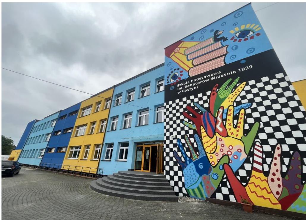
Budynek Szkoły Podstawowej w Gostyni