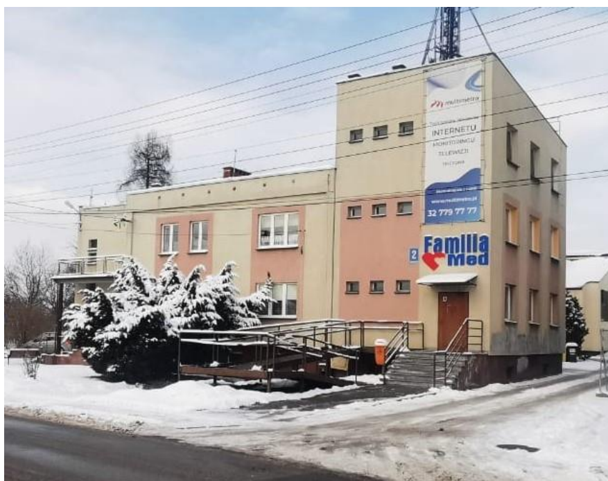
Budynek ośrodka zdrowia

Uchwałą nr XVIII/124/2000 Rada Gminy Wiry postanowiła wybrać formę organizacyjną prowadzenia Podstawowej Opieki Zdrowotnej na terenie Gminy Wiry od 1 stycznia 2001 roku, w postaci indywidualnych lub grupowych praktyk lekarskich jako niepubliczny Zakład Opieki Zdrowotnej, zapewniających mieszkańcom podstawową opiekę zdrowotną zarówno w miejscowości Wiry jak i Gostyń.