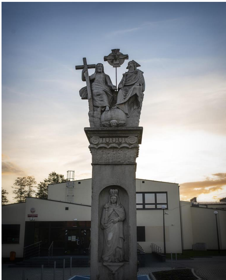
Figura Trójcy Świętej przy ul. Pszczyńskiej

Przy ul. Rybnickiej znajduje się Kościół p.w. Świętych Apostołów Piotra i Pawła wybudowany w latach 1935 – 1939.