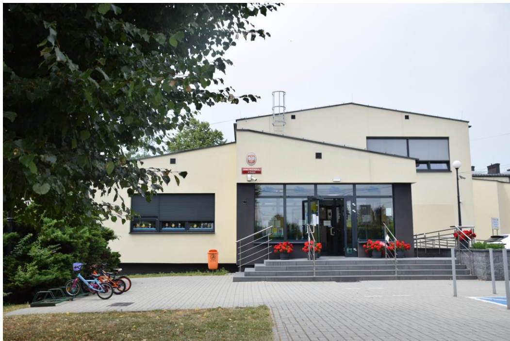
Budynek Gminnego Przedszkola w Gostyni

Obecnie w przedszkolu znajduje się 6 sal zajęć, w których na co dzień przebywa 149 przedszkolaków oraz przeszklone pomieszczenie ogrodu zimowego. Budynek przedszkola wyposażony został w windę dla osób niepełnosprawnych, obsługującą parter i I piętro. W terenie, wokół budynku wykonano szereg prac, m.in.: wyremontowano istniejące i wykonano nowe nawierzchnie utwardzone, doposażono istniejący placu zabaw o nowe urządzenia, wyremontowano nawierzchnię przed wejściem głównym, wydzielono miejsce parkingowe dla osób niepełnosprawnych.