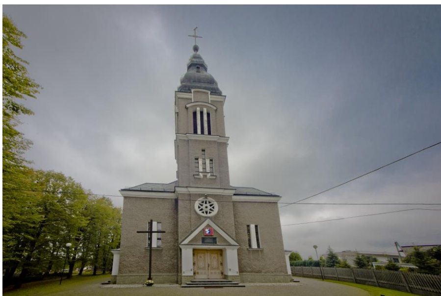
Kościół p.w. Świętych Piotra i Pawła

Przy ul. Rybnickiej znajduje się Kościół p.w. Świętych Apostołów Piotra i Pawła wybudowany w latach 1935 – 1939.