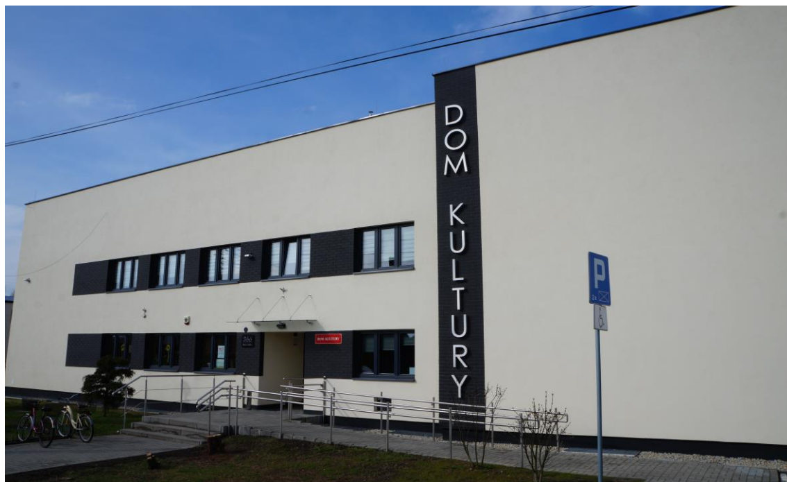
Budynek Domu Kultury w Gostyni

W Domu Kultury organizowane są również liczne zajęcia mające wpływ na rozwój kulturalny i styl życia mieszkańców, tj. m.in.: gimnastyka, wyjazdy i wycieczki, spotkania seniorów, spotkania działaczy i administratorów kultury oraz imprezy i zabawy okolicznościowe. Ponadto Dom Kultury posiada pod wynajem sale na szkolenia, wesela i imprezy okolicznościowe.