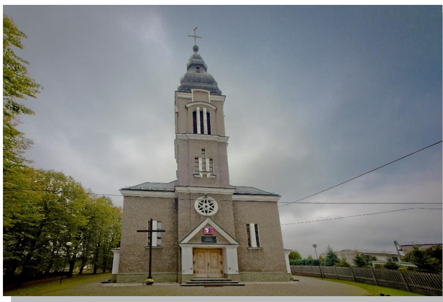
Kościół p.w. Świętych Piotra i Pawła

Przy ul. Rybnickiej znajduje się Kościół p.w. Świętych Apostołów Piotra i Pawła wybudowany w latach 1935 – 1939.