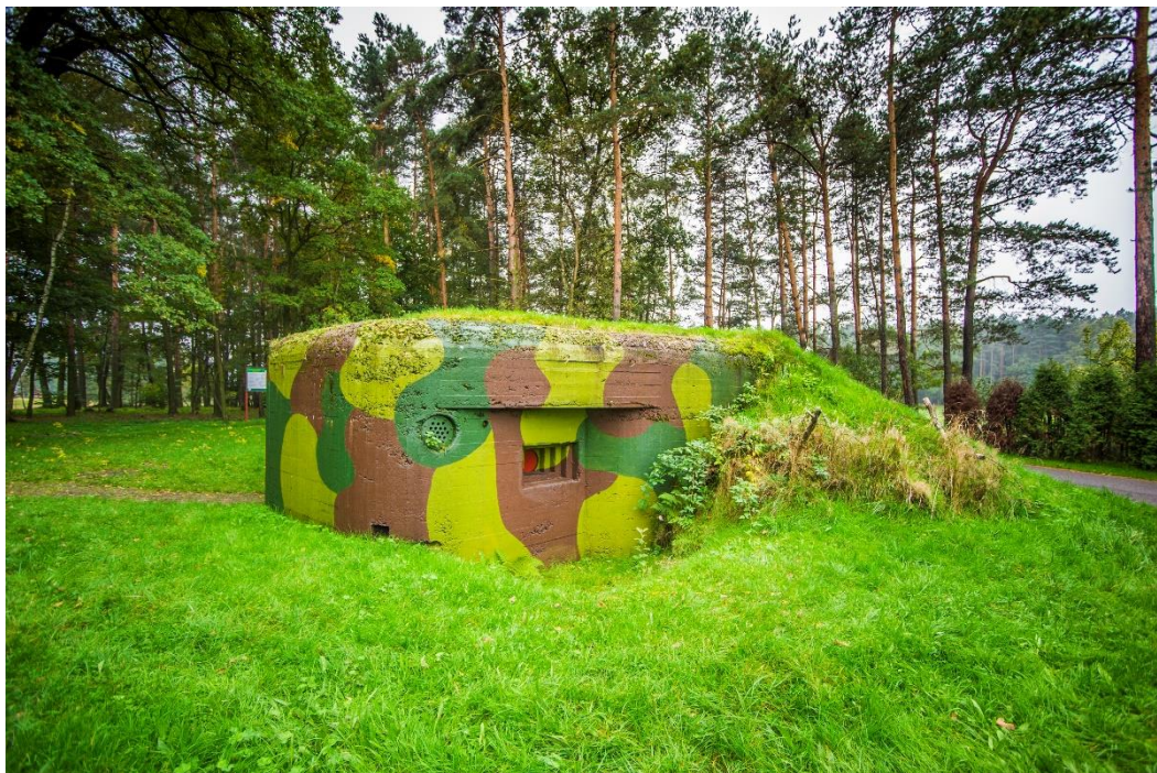
Schron bojowy „Sowiniec”