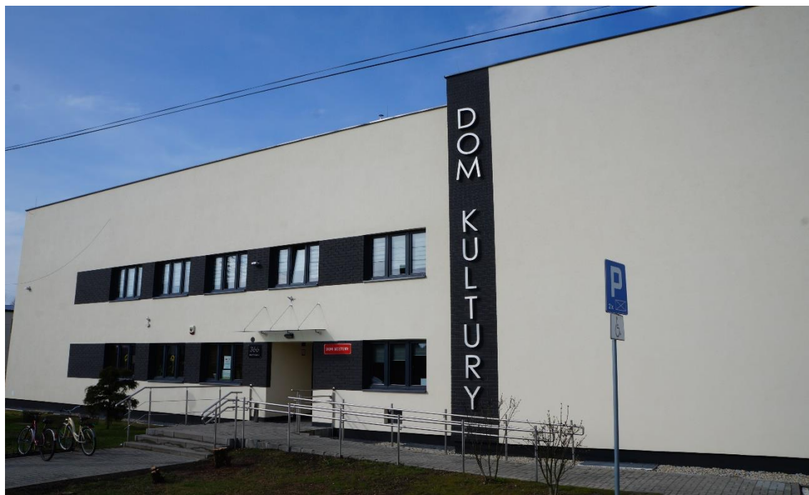
Budynek Domu Kultury w Gostyni

W Domu Kultury organizowane są również liczne zajęcia mające wpływ na rozwój kulturalny i styl życia mieszkańców, tj. m.in.: gimnastyka, wyjazdy i wycieczki, spotkania seniorów, spotkania działaczy i administratorów kultury oraz imprezy i zabawy okolicznościowe. Ponadto Dom Kultury posiada pod wynajem sale na szkolenia, wesela i imprezy okolicznościowe.