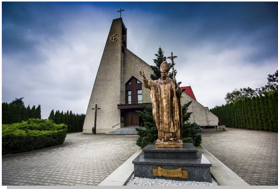
Kościół p.w. Podwyższenia Krzyża Świętego

Obok cmentarza parafialnego przy ul. Rybnickiej znajduje się kaplica cmentarna (wcześniej kościół p.w. Podwyższenia Krzyża Świętego), wybudowana w 1922 r. Na cmentarzu jest również zbiorowy grób polskich żołnierzy poległych we wrześniu 1939 r. oraz mogiła zbiorowa żołnierzy niemieckich zabitych w tym samym czasie. Obok cmentarza znajduje się nowy Kościół p.w. Podwyższenia Krzyża Świętego konsekrowany w 1997 r.