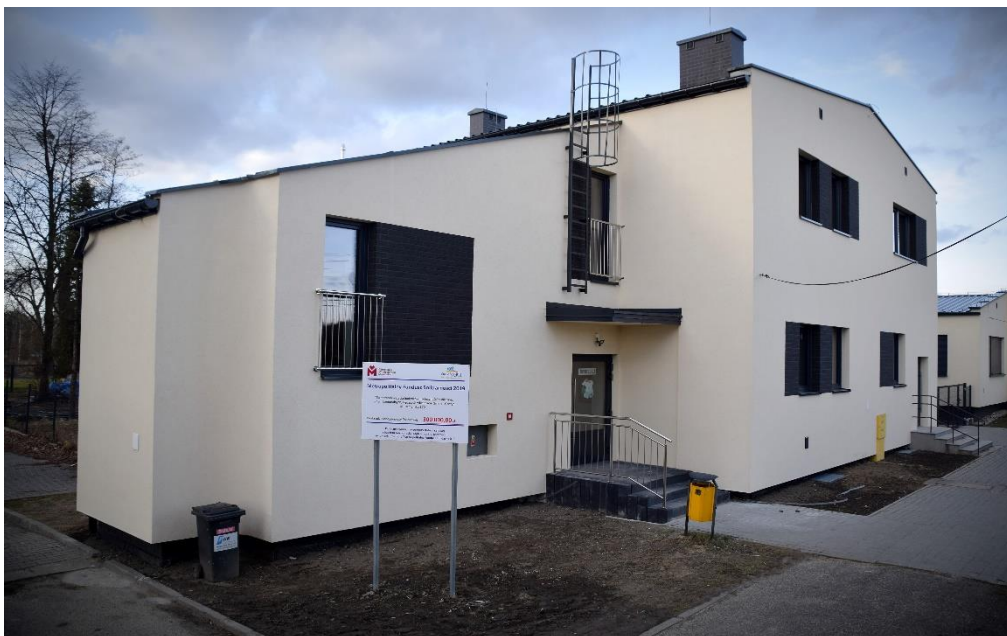
Siedziba świetlicy środowiskowej w Gostyni

z udostępnionych dla nich różnego rodzaju gier, zabaw, oglądają filmy, bajki. Często wychodzą także na spacerów bądź uczestniczą w zorganizowanych wycieczkach. Kiedy trzeba odrobić pracę domową także mogą skorzystać z pomocy w nauce, opiekunowie również starają się rozwijać zainteresowania wśród młodzieży, poprzez organizację różnych zajęć tematycznych.