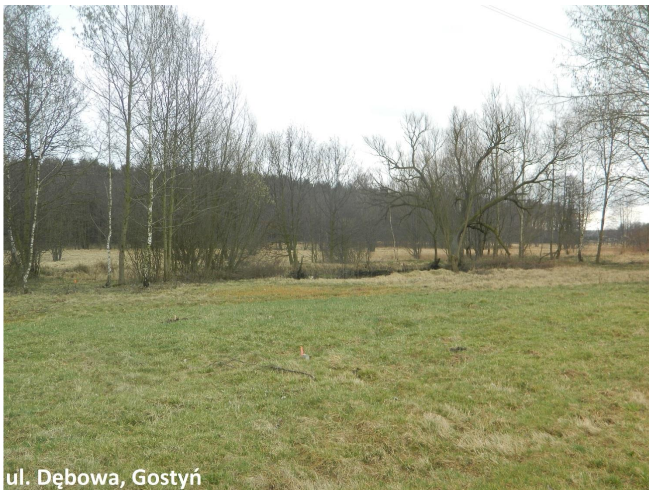
ul. Dębowa, Gostyń